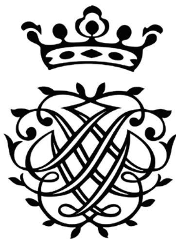
8. Monogram wiązany J S B (Jan Sebastian Bach), ok. 1735. Fot. z archiwum autora.