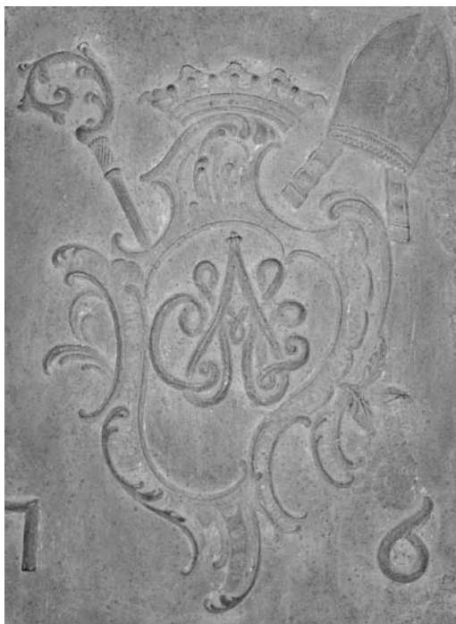
6. Część centralna tablicy ufundowanej w 1767 r., monogram wiązany C I M A L (Constantinus Iłowiecki Modernus Abbas Landensis).