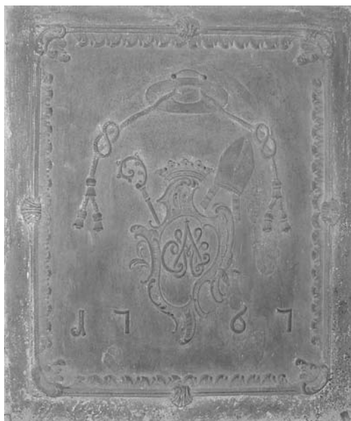
4. Pamiątkowa płyta żeliwna z inicjałami opata Konstantego Iłowieckiego, 1756 r., Łąd nad Wartą.