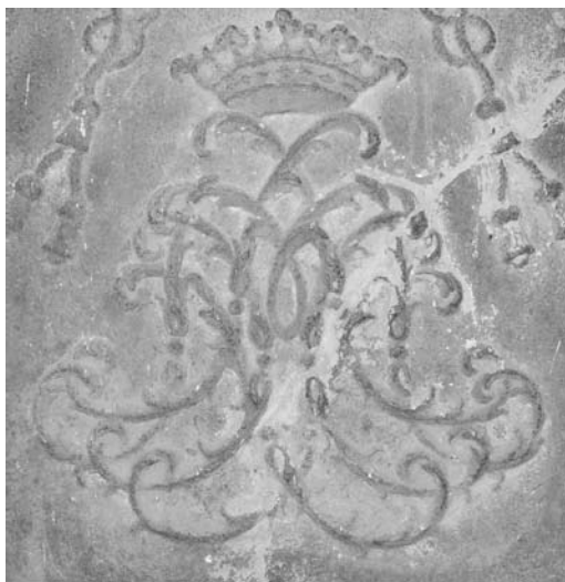
5. Część centralna tablicy ufundowanej po 1752 r., monogram wiązany I C I A L C V (Illustrissimus Constantinus Iłowiecki Abbas Landensis Comissarius Vicarius [Generalis]).