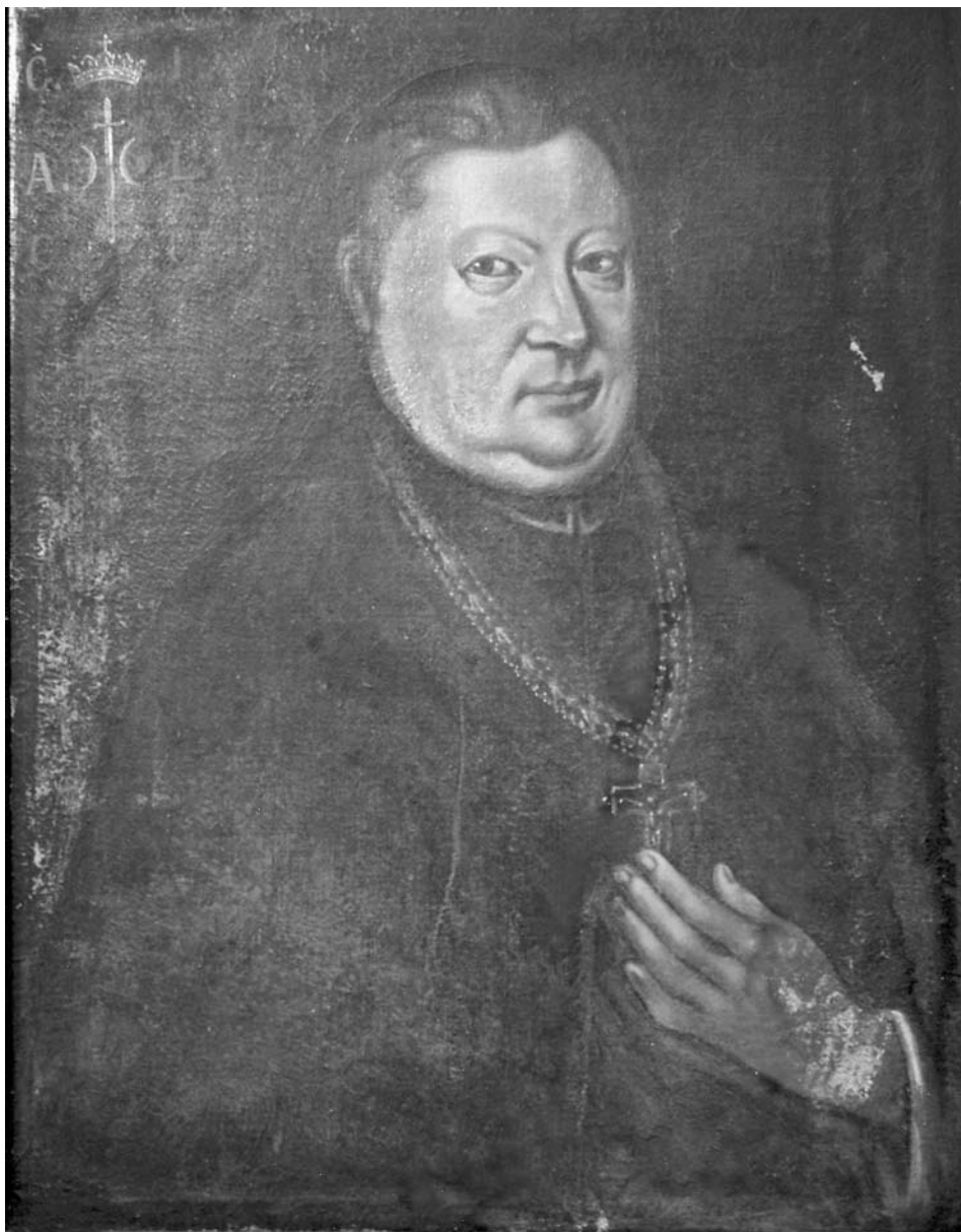
2. Autor nieokreślony, portret opata Konstantego Iłowieckiego, olej na płótnie, po 1752 r., kościół parafialny w Łądku.