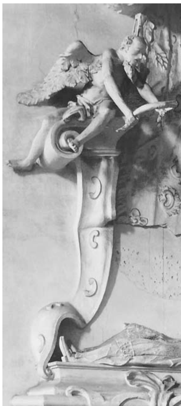
1. Fragment nagrobka opata Mikołaja A. Łukomskiego z kryptosygnaturą fundatora C I (Constantinus Howiecki), po 1750 r., Łąd nad Wartą.