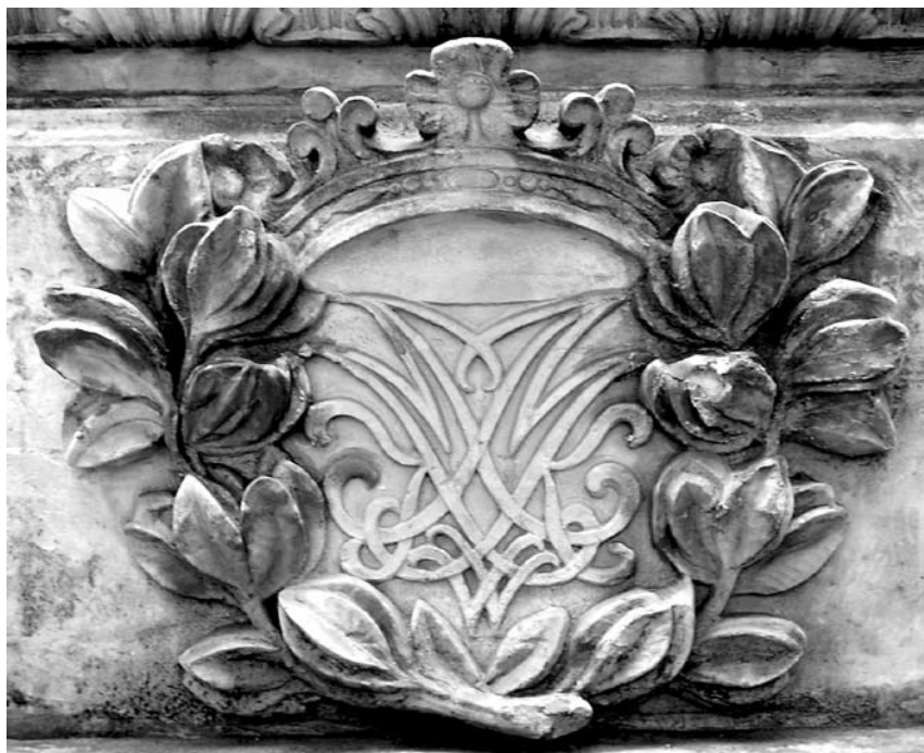
7. Kartusz z monogramem wiązonym J M K / W (Józef Mniszech Konstancja / Wandalin), kartusz w cokole figury św. Jana Nepomucena na ul. Senatorskiej w Warszawie, 1733 r.